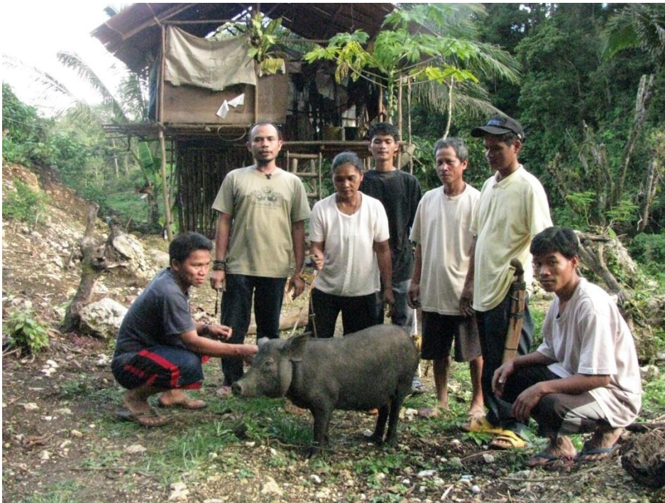
Boeren kregen varkens om te fokken en de jongen door te geven

Zonder deze moorden zou ons verslag over de ontwikkelingen op en rond de landbouwschool een heel positieve zijn geweest. In 2014 kreeg de school een regionale en een nationale prijs voor haar uitstekende kwaliteit van onderwijs, het bevorderen van haar duurzame landbouwmethodes en het creëren van ontwikkeling en werkgelegenheid. De school heeft zo'n goede naam dat er inmiddels in een andere regio van Mindanao een 2 e is opgericht. Daar is een heel proces aan voorafgegaan, omdat zeker en duidelijk moet zijn dat de omliggende gemeenschappen en ook de lokale overheden de school zullen steunen. Dat ze ook weten wat er van hen verwacht wordt aan activiteiten. Denk bv. aan het volgen van trainingen in landbouwontwikkeling en het gezamenlijk bewerken van de gemeenschappelijke akkers. Omdat de school samengaat met het opzetten van ontwikkelingsprojecten worden ook duidelijke afspraken gemaakt over de terugbetaling van verstrekte materialen en dieren. Van verstrekte zaden bv. moet na de eerste oogst dezelfde hoeveelheid zaden teruggegeven worden, en na de tweede oogst nog eens de helft daarvan om de aangelegde zaadbanken te kunnen bevoorraden. En bij verstrekt kleinvee als kippen, geiten en varkens moet het aantal ontvangen dieren na geboorte van nieuwelingen in gelijk aantal doorgegeven worden aan boeren die nog niets of weinig hebben. Het project verdeelt namelijk in de dorpen zaden, landbouw materiaal en kweekvee (kippen, biggen, geiten).