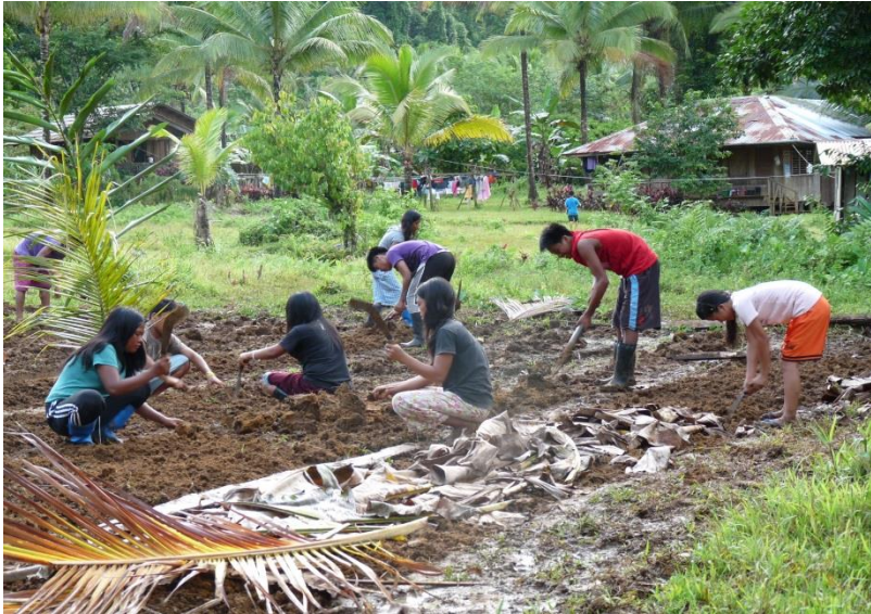
Leerlingen van Alcadev aan het werk op het land.

De anderen waren een dorps hoofd en een inheemse boerenleider. Zoals u uit vorige rondzendbrieven weet, runt Alcadev in het noordoosten van Mindanao een secundaire landbouwschool voor inheemse jongeren, die anders geen opleiding kunnen krijgen. De jongeren leven en werken op de school, en keren in de weekends en de vakanties terug naar hun bergdorpen waar ze datgene wat ze geleerd hebben, toepassen samen met andere dorpelingen en zo de landbouw verbeteren en de honger terugdringen. De school aarzelt niet om inheemse bevolkingsgroepen zoals de Lumads, die in ons projectgebied wonen, te steunen in hun