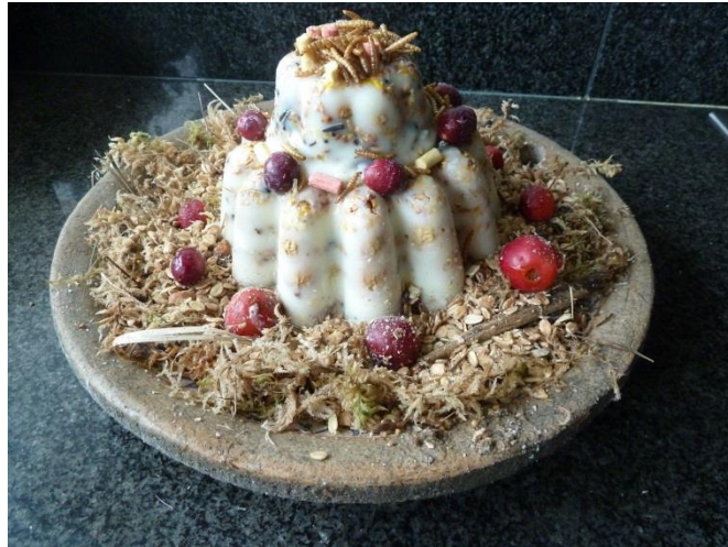
Vogeltaart voor vogels in de tuin

In deze brief één van de "vogeltaarten" voor in de tuin.